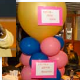
Festival 'Mooi meegenomen', met veel activiteiten voor kinderen

Van 10 - 17 oktober organiseerde de Armoedecoalitie de jaarlijkse Week van de Armoede, met als slot de manifestatie 'Mooi meegenomen'. Daarin allerlei 'verwennerij' voor de doelgroep.