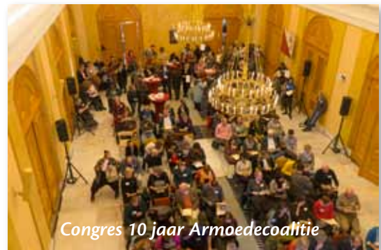
Congres 10 jaar Armoedecoalitie

Op 4 november vond een jubileumcongres plaats i.v.m. 10 jaar Armoedecoalitie Utrecht, met pittige discussies met plaatselijke en landelijke politiek, de oprichting van een landelijke armoedecoalitie en de presentatie van een boek met ervaringsverhalen: 'Licht op armoede'.